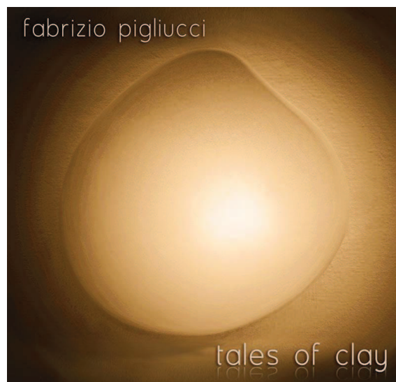
Cover art "Shapes of Clay" by Alessandra Bosco

A collection of tales in music, ancient and modern, from close to far countries.. the importance of an awakening, especially in our times, of a conscious return to ourselves, to the simple and central values of life as earth, memory, friendship, to overcome divisions, rancor and arrogance, planting new seeds of love and understanding that we are all interconnected, men and nature .. emotional music that combines tradition and modernity.. all is related, all is One ..